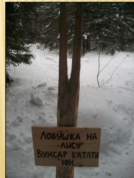
Ловушка на лису