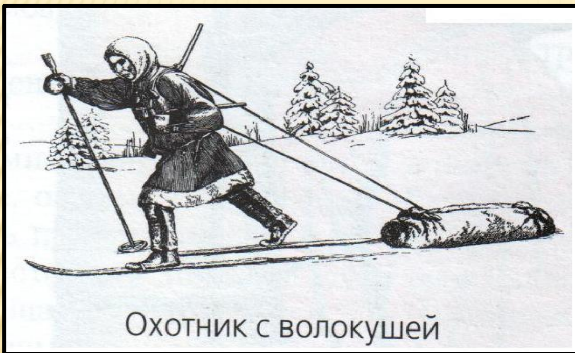
Охотник с волокушей