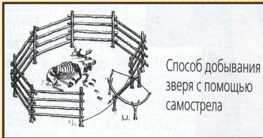
Способ добывания зверя с помощью самострела