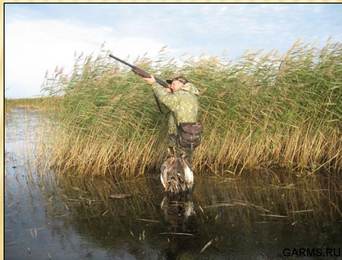
Охотник . 21 в.