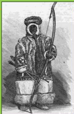
Остяк. 1882 г.