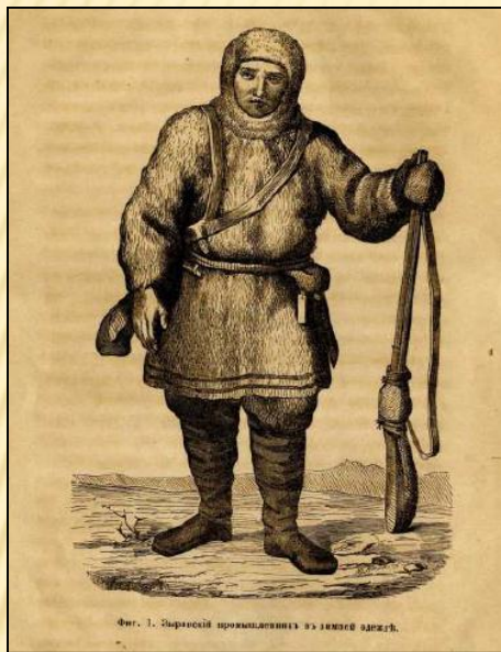
Фиг. 1. Широкосей промысловик из зимнего одяжб.