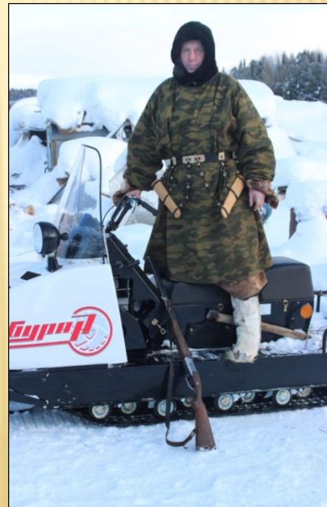
Охотник на снегоходе. 2010 г.