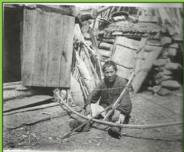
Остяк с самострелом на зайцев и лисиц. 1910 г.